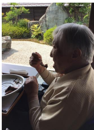
和風庭園を眺めながらのコーヒータイム♪