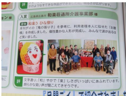
『月刊DAY』で紹介されました♪

デイサービスの趣味活動では、季節に沿った作品を制作しています。今回は、風鈴と七夕飾りを作りました。みんなで作る大きな作品として、カープの壁画を完成させました！！ご利用者様は皆さんカープが大好きです。壁画を作りながら、昨日の試合はどうだったなど、カープの話に花が咲きます。