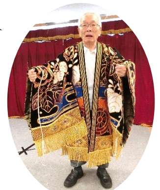
舞衣を着せていただきました